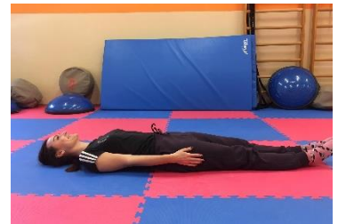
Ľah na chrbte