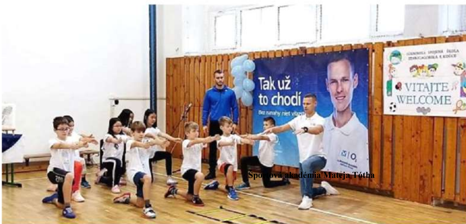
Športová akadémia Mateja Tótha