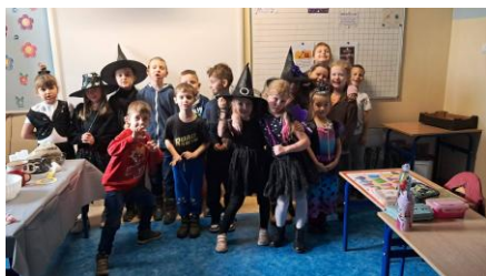
Andrzejki – magia na wyciągnięcie ręki

Jeśli ktoś myśli, że życie w szkole to tylko matematyka i polski, to grubo się myli. W ostatnich tygodniach uczniowie Szkoły Podstawowej nr 4 w Walczu pokazali, że nauka może być przygodą pełną magii, śmiechu i nowych doświadczeń. A wydarzeń było tyle, że aż trudno wybrać, od czego zacząć!