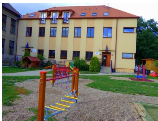
II. třída MŠ ve zděné přístavbě budovy