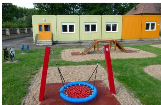
I. třída MŠ z montovaných buněk

Provozní doba mateřské školy je od 6.00 do 16 hodin.