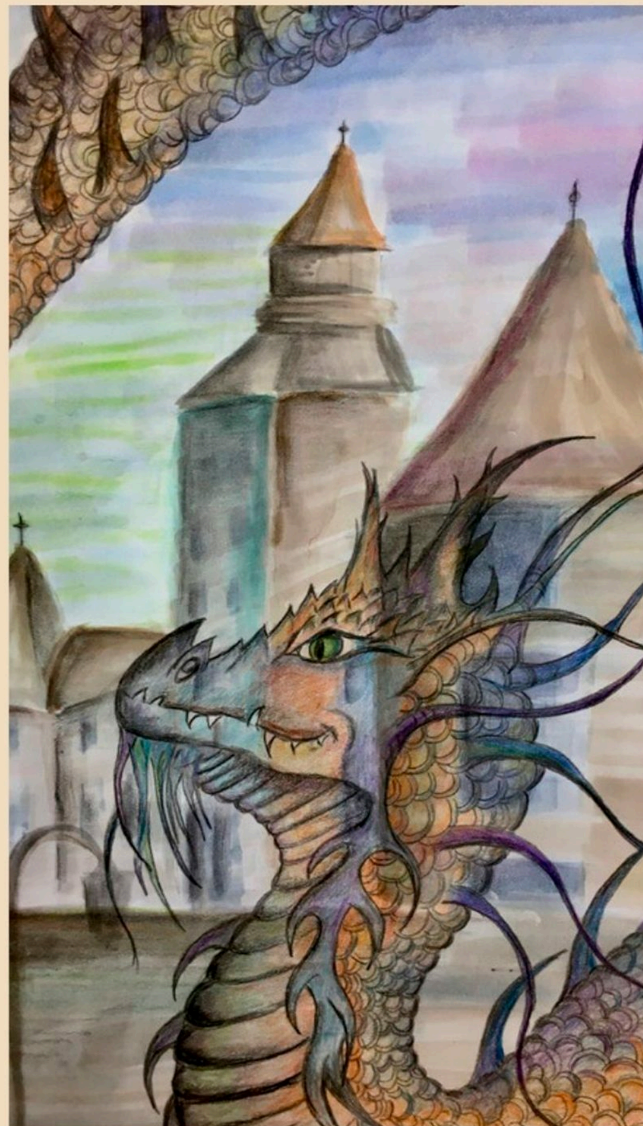
Autorka článku i ilustrácie : Janka Hanulíková

Ak máte záujem, môžete si o drakovi viac prečítať na stránke mesta Bytča: http://www.bytca.sk/bytciansky-drak/