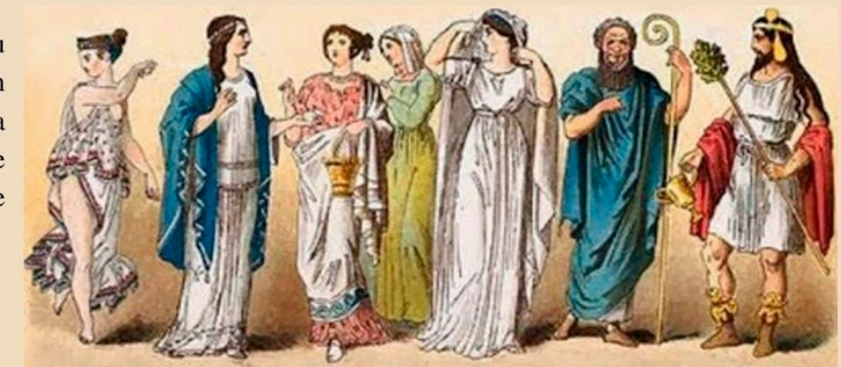
Autor príspevku: Peter Ondrušek