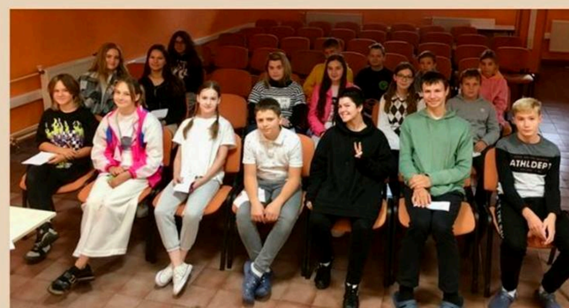
Tím nášho školského parlamentu na šk. rok 2022/2023