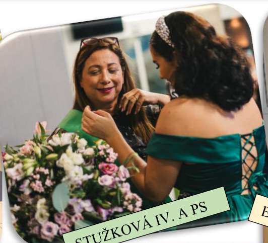
STUŽKOVÁ IV. A PS