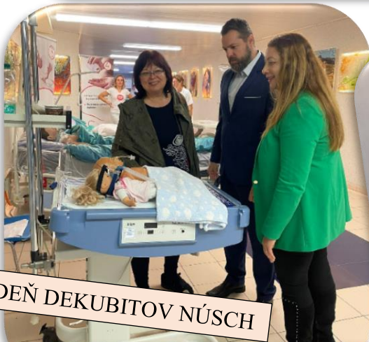
DEŇ DEKUBITOV NÚSCH