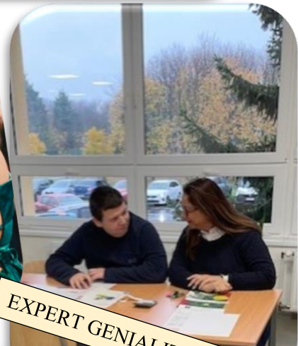
EXPERT GENIALITY SHOW