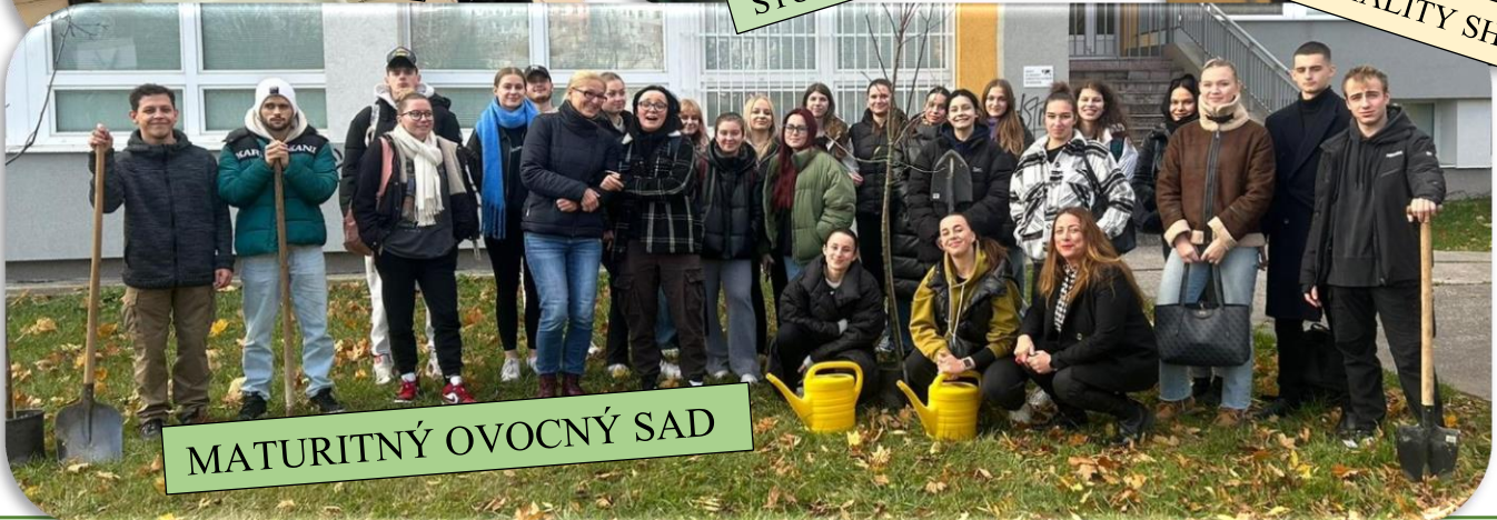
MATURITNÝ OVOCNÝ SAD

ROČNÍK XXIV., ČÍSLO 1 ŠKOLSKÝ ROK 2023/2024