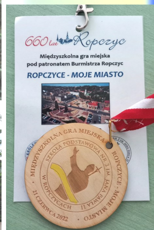
Ogłoszenie wyników i rozdanie nagród