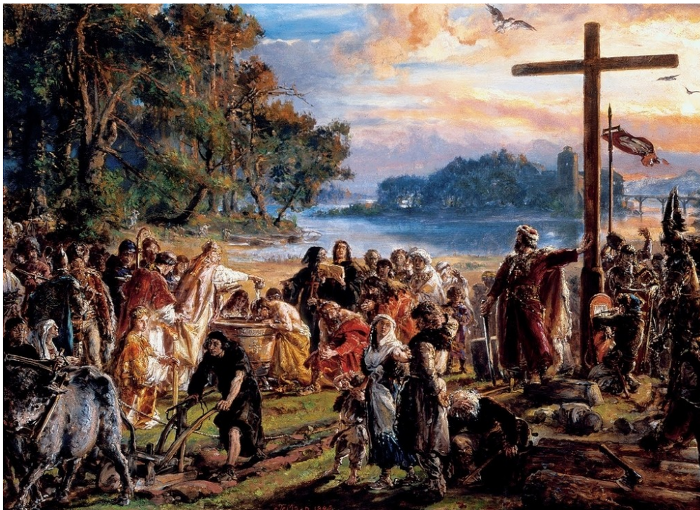
Jan Matejko, „Zaprowadzenie chrześcijaństwa R.P. 965”, z cyklu „Dzieje Cywilizacji w Polsce”, (1889 rok)

Obraz Jana Matejki pokazuje wielki przełom, który stał się fundamentem Polski. Obyło się wówczas bez większych niepokojów zapewne głównie z powodu strachu przed twardym i zdecydowanym władcą.