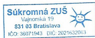
NÁJOMCA Zdena Némethyová

ZŠ MĚDŇANÁ ŠKOLA Hľbocká cesta 4 011 04 BRATISLAVA -2-