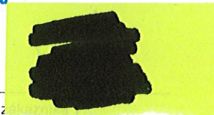
Firma / meno priezvisko z Základná škola s MŠ S.Štúra Lubina, 916 12 Lubina 1

Základná škola s materskou školou Samuela Štúra 916 12 Lubina č.1 IČO: 36125105 DIČ: 2021605201 tel.: 032/777 84 06 -2-